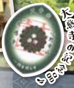
相良酒造のお土産♪